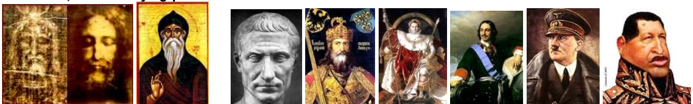
Mesías Cristo, mesías Abraham.

El modelo romano del emperador dictatorial se tradujo de manera indirecta en las dictaduras de todos los ismos de izquierda que se inflan y desinflan unos tras otros: socialismo, comunismo, fascismo, hitlerismo, maoísmo, castrismo, chavismo y “¿quién da más?”